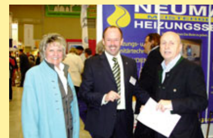
... Wirtschaft & Politik