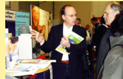
... intensiver Wissenstransfer