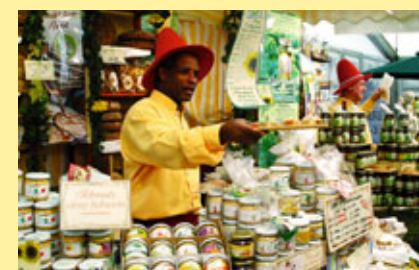
... gesunde Alternativen