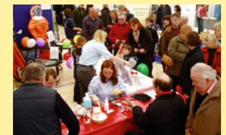
... praxisnahe Beratung