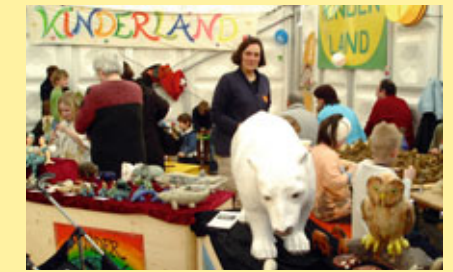
... umweltpädagogische Kinderbetreuung