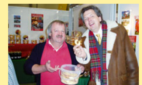
... glaubwürdige Anbieter