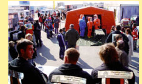
... interessante Vorführungen