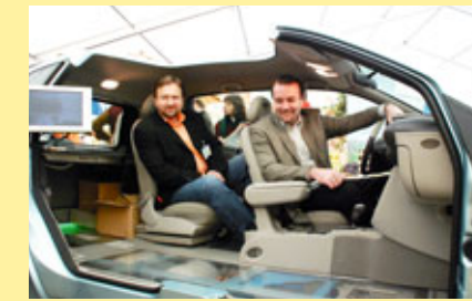
... Brennstoffzellen ...