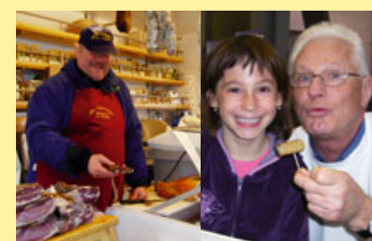
... leckere Bio-Schmankerl