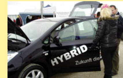
... und Hybrid-Technik